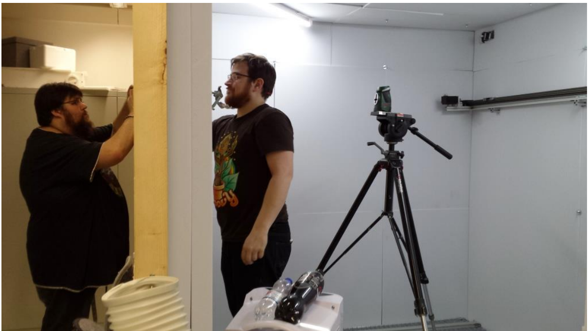
Anbringen der Halterungen