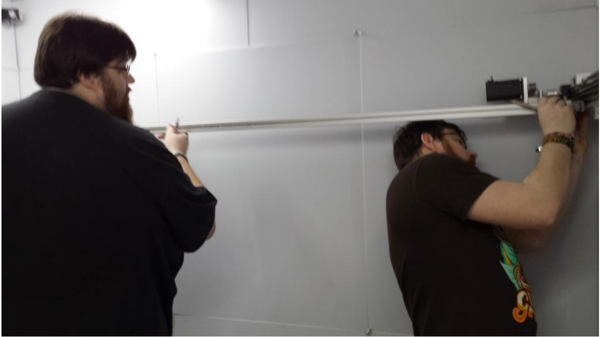
Einmessen des Portals